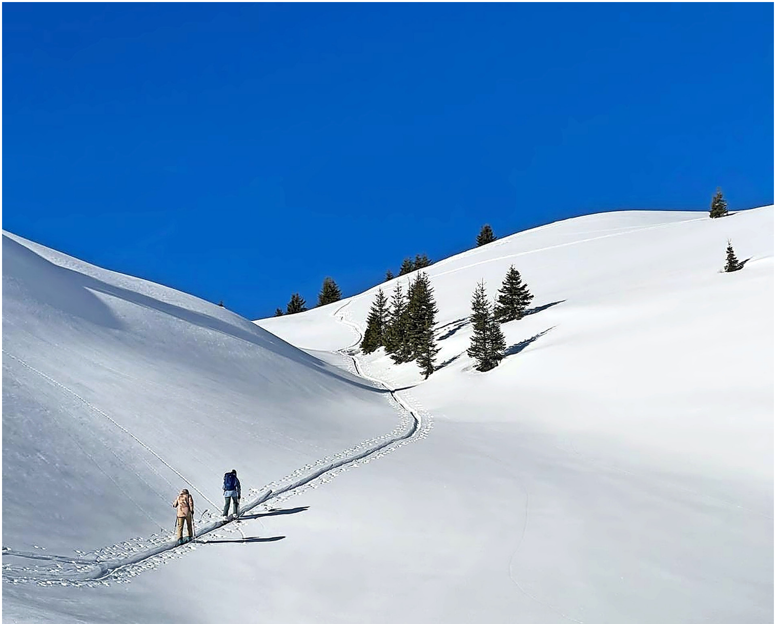
Der Reiz für Skitouren liegt für viele Menschen darin, auf eigenen Spuren im Schnee zu gehen.