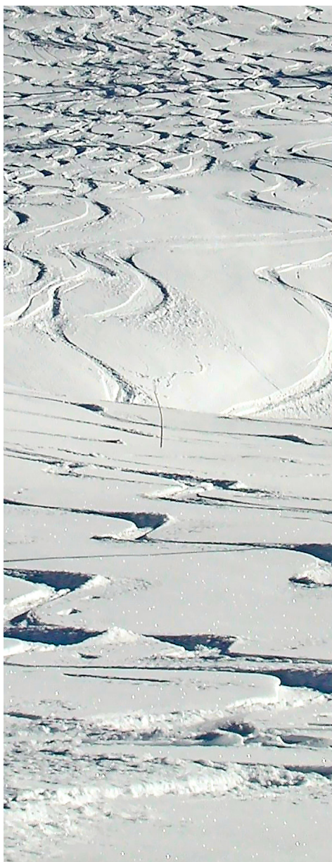
Mit dem Trend steigt auch der Druck auf die Natur.

angelehnt. Dass die Wettkampfsportart als Sprintdisziplin nun mehr Aufmerksamkeit bekommt, freut den Prättigauer. Und er hofft, diese Aufmerksamkeit für das Projekt nutzen zu können, welches ihn beruflich beschäftigt: «Graubünden Skitour».