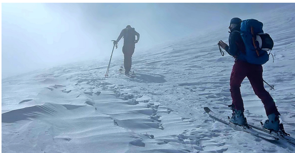
«Graubünden Skitour» möchte das touristische Potenzial von Skitouren ausschöpfen.

Im Projekt sind verschiedene Handlungsfelder definiert. Einige davon gehen vom Breitensport in den Wettkampfsport. So brauche es zum Beispiel gesicherte Trainingsmöglichkeiten für Athletinnen und Athleten. Bisher müssen sie auf Skipisten ausweichen, der Konflikt ist vorprogrammiert. Orte zu schaffen, wo sicher trainiert werden könne, erleichtere nicht nur den Einstieg in den Sport allgemein, sondern sei wichtig für die Nachwuchsförderung. Denn anders als beim Breitensport Skitou-